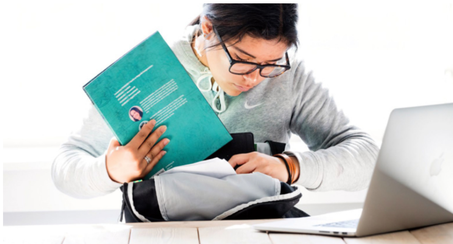
– Dersom opplegget med hjemmeskole varer, bekymrer jeg meg for hvilke konsekvenser dette får for forskjeller i befolkningen når det gjelder kvaliteten på barns utdanning, skriver kronikkforfatteren.

S om doktorgradsstipendiat i sosialt arbeid har jeg intervjuet minoritetsmødre om hvordan de forholder seg til at foreldreskapet blir stadig mer digitalisert. Noen av mødrene klarer de digitale oppgavene som foreldreskapet medfører bra, men en del opplever store utfordringer. Konsekvensene er at mødrene